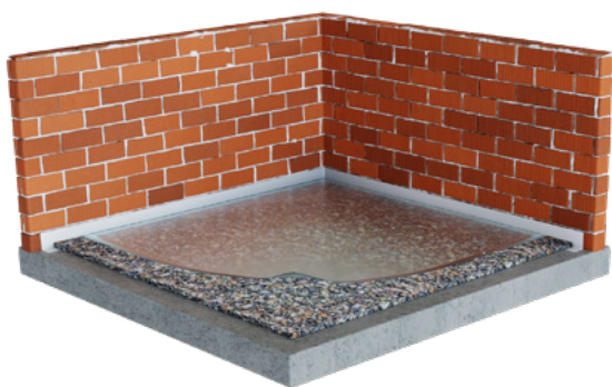
PASO 3: Aplicar plástico protector sobre la cara vista de RECYPREN®.