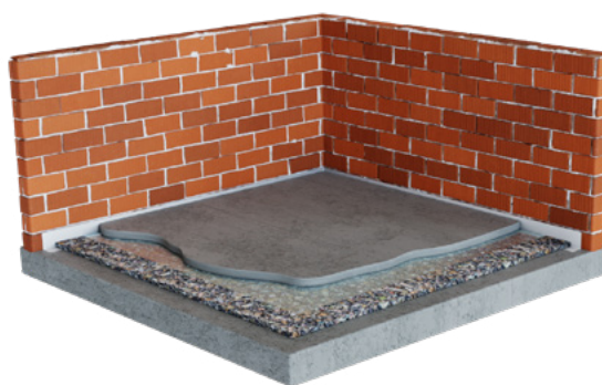
PASO 4: Aplicar pegamento sobre la cara vista de RECYPREN®.