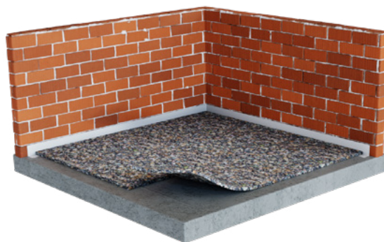
PASO 2: Aplicar cola profesional sobre la cara de RECYPREN®.